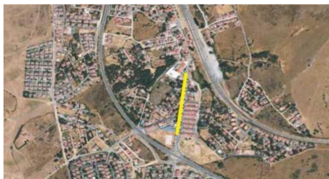
Aparcamiento Calle Carretera

Art. 17: DERECHOS DE IMAGEN: Todos los corredores renuncian expresamente a su derecho de imagen durante la prueba y a todo recurso contra la organización por la utilización de dicha imagen. La organización podrá autorizar a los medios de comunicación a utilizar dicha imagen mediante una acreditación o licencia. Toda comunicación sobre el evento o la utilización de imágenes de este deberá realizarse respetando el nombre de dicho evento, de las marcas registradas y previa autorización de la organización. La entidad organizadora se reserva en exclusividad el derecho sobre la imagen de la prueba, así como la explotación audiovisual y periodística de la competición. Cualquier proyecto mediático o publicitario deberá contar con el consentimiento de la organización.